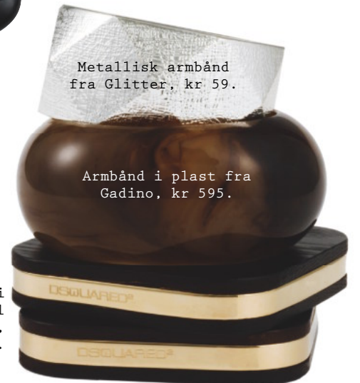
Metallisk armbånd fra Glitter, kr 59.