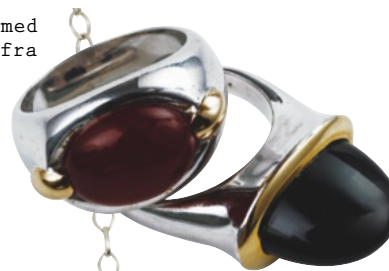
Sølvring med svart sten fra Dendarra, kr 2.800.