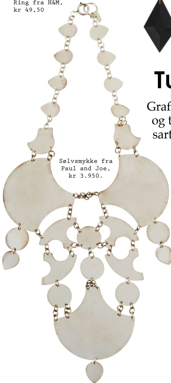
Sølvsmykke fra Paul and Joe, kr 3.950.

Grafiske tunge smykker i metall, plast og tre gir en fin effekt til sommerens sarte kjoler i florlett silke og chiffon.