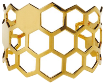
Gullforgylt armbånd fra David & Martin, kr 1.499.