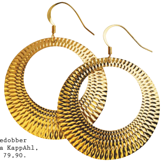
Øredobber fra KappAhl, kr 79,90.