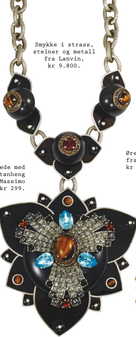
Smykke i strass, steiner og metall fra Lanvin, kr 9.800.