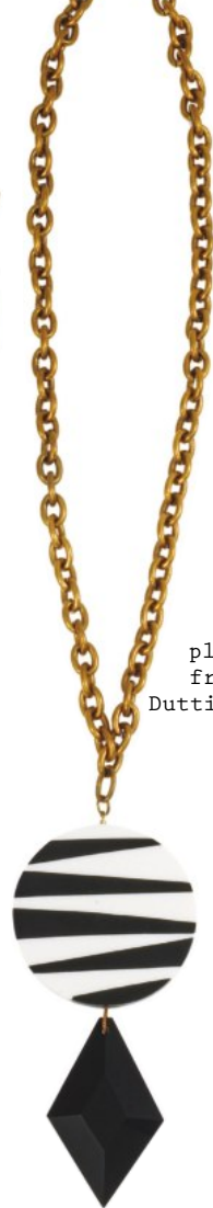
Kjede med plastanheng fra Massimo Dutti, kr 299.