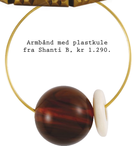
Armbånd med plastkule fra Shanti B, kr 1.290.