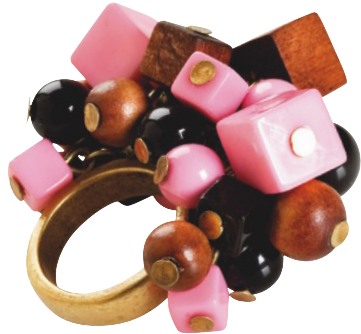
Ring fra H&M, kr 49,50