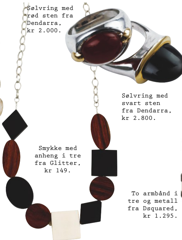
Sølvring med rød sten fra Dendarra, kr 2.000.