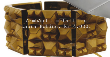
Armbånd i metall fra Laura Bohinc, kr 4.000.